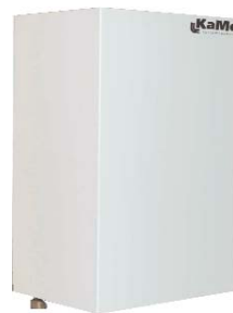
Waal Compact in mantel